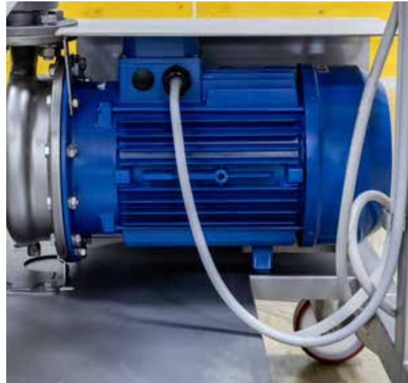
BOMBA CENTRÍFUGA ESPECÍFICA PARA FLUTUAÇÃO

A inclinação das aletas da bomba foi modificada para garantir uma pressurização idela do mosto.