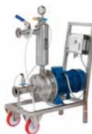
E-Flot 5 Eco