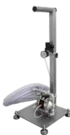
Adagoló autoklávokhoz szivattyúval maximum 18 l/min