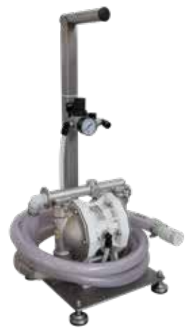
Adagoló autoklávokhoz szivattyúval maximum 50 l/min