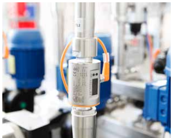
计量器 控制计量准确性。