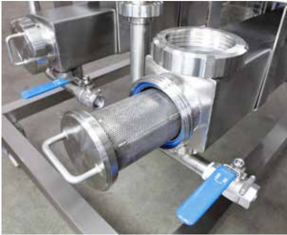
预过滤 三个预过滤器，以避免计量泵出现堵塞问题。