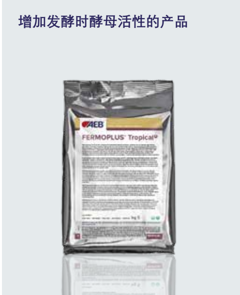
增加发酵时酵母活性的产品