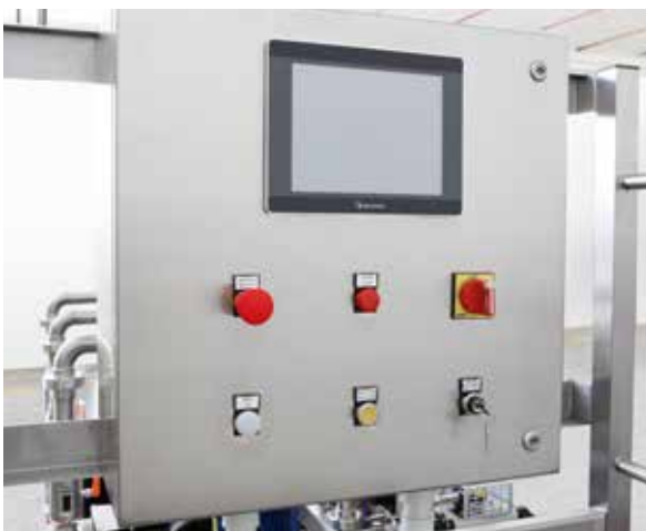
电子面板 借助大型触摸屏，您可以轻松设置所需的各种剂量。